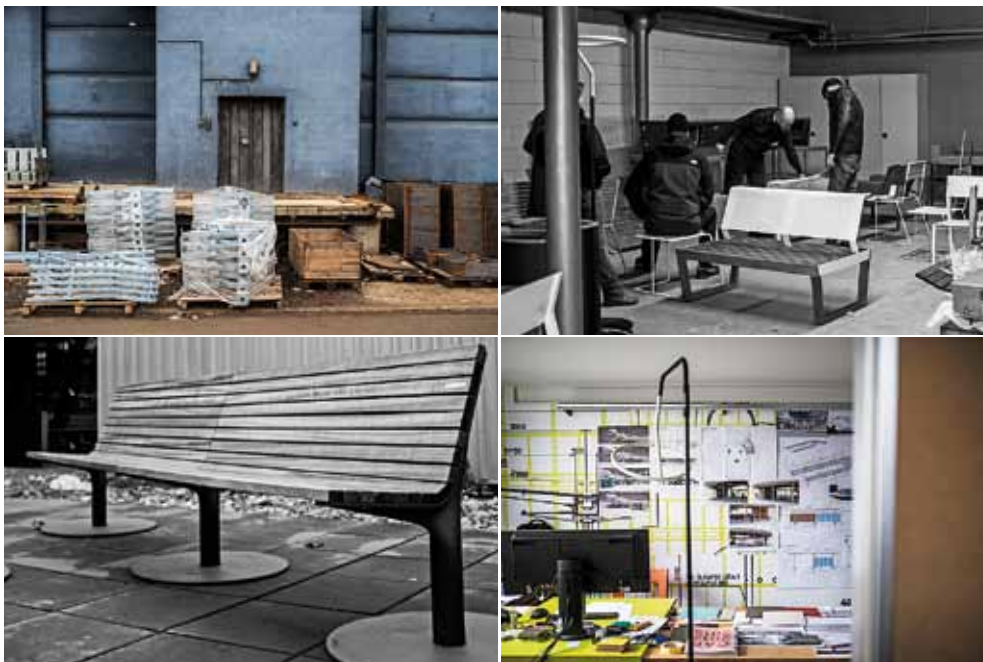
Letos v únoru obdržela firma mmcitě za vybrané prvky ze svého městského mobiliáře ocenění v celosvětové soutěži Good Design.