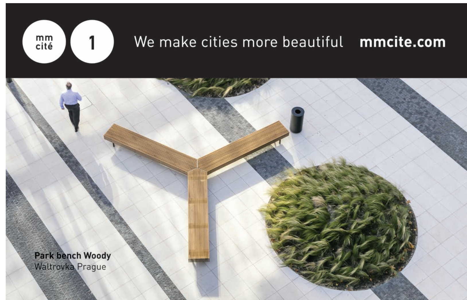
Park bench Woody Waltrovka Prague

Our collection of urban fixtures and fittings is particularly broad, from barrier posts, bike stands and waste bins to bus stop shelters. However, the biggest part covers benches, where we offer more than 20 line types. Those