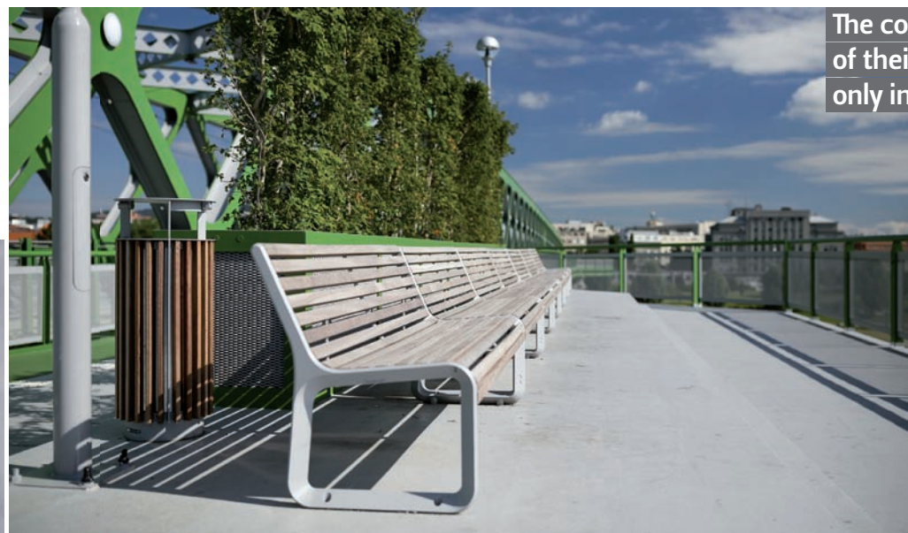
Lavička Portiqoa, Starý most, Bratislava Portiqoa bench, Old Bridge, Bratislava

Neznamená to, že nutně musí být po celém městě jednotný mobiliář, jsou lokality, které si zasluhují odlišný přístup. Snažíme se tomu vyjít vstříc a nabízíme v každé kategorii výrobků více materiálů, ale hlavně stylových poloh, aby naše města byla skutečně krásná.